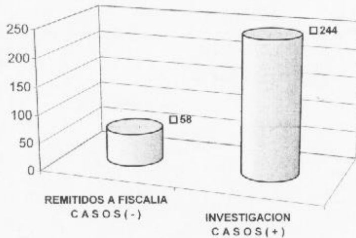
CASOS REMITIDOS Y EN INVESTIGACION A NIVEL NACIONAL ENERO Y FEBRERO 2004